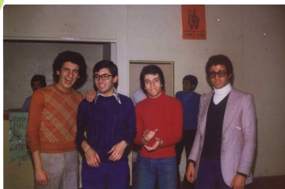
A peine débarqué de sa Tunisie natale avec son groupe de Tunis