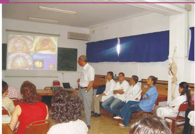
Liens avec la Faculté de Médecine Dentaire de Monastir

Président de la Société Francophone de Médecine buccale et de Chirurgie buccale...) et j'ai le grand honneur depuis quelques mois (Lisbonne, avril 2011) de présider la « European Federation of Oral Surgery Societies / EFOSS ». Mes travaux comportent pour le moment 14 participations à la rédaction d'ouvrages, 48 publications dans des revues internationales et 150 conférences dans des manifestations scientifiques internationales.